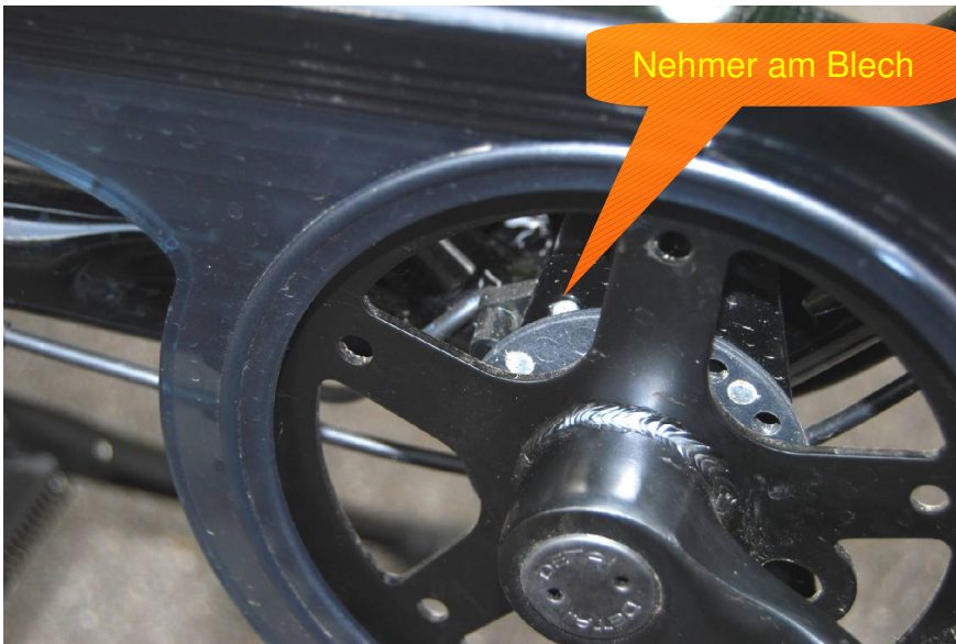
Nehmer am Blech