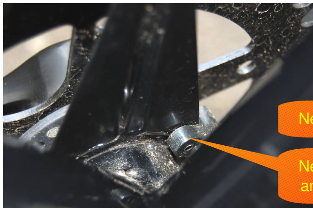
Nehmer am Blech