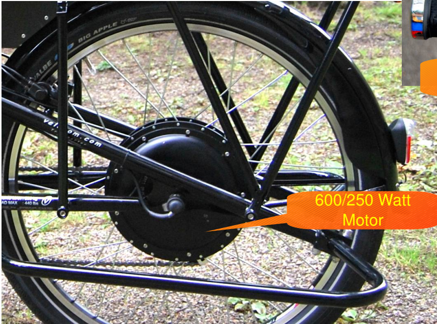
600/250 Watt Motor