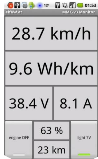
Smartphone als Display und Bedienelement (nicht im Lieferumfang)